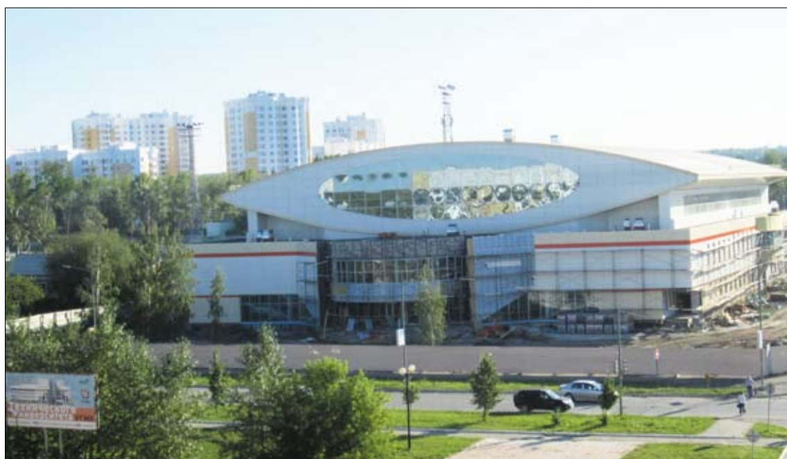
Ледовый дворец станет украшением центральной части Верхней Пышмы.