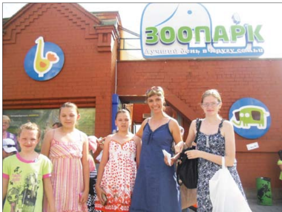
Поездка в зоопарк запомнилась всем детям.

П ОЗНАВАТЕЛЬНУЮ поездку в Екатеринбургский зоопарк организовали активисты профкома Уралэлектромеди участниками конкурса детских рисунков «Мир глазами ребёнка».