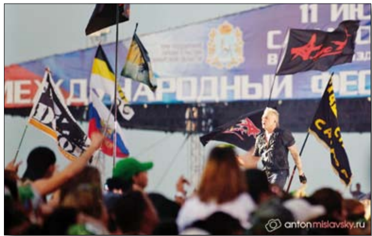
На сцене легенда русского рока — группа «Алиса».