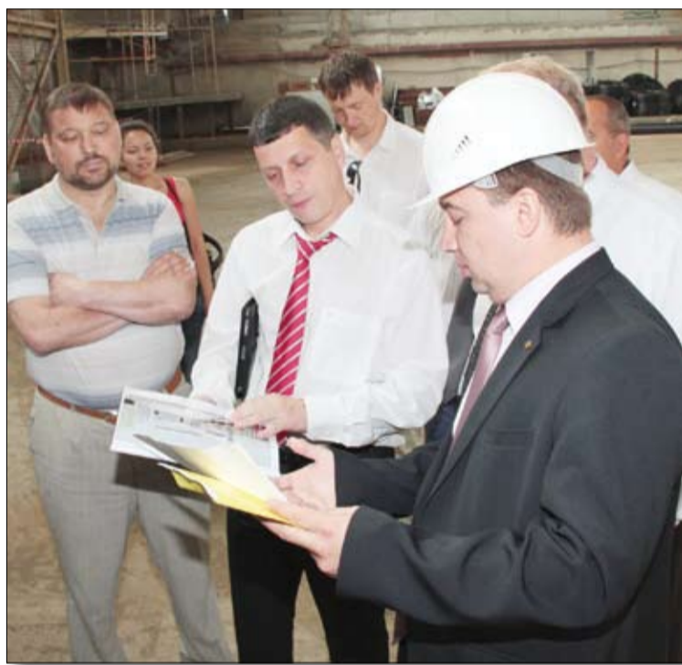
Министр Л. Рапопорт (в центре) доволен ходом строительства.

прошедшими за пять месяцев изменениями был приятно изумлён. Первый этаж уже готов на 80 процентов: это административные кабинеты, актовый зал, часть учебных классов, медицинский блок. Полностью готов второй этаж. Идут работы на третьем этаже – там спальные комнаты, душевые, бытовые и хозяйственные помещения, рекреации для игр и отдыха.