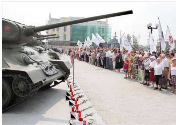
У «Памятной линии огня».