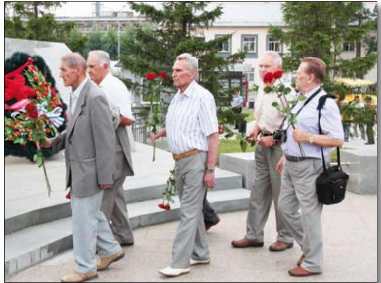
Цветы к мемориалу возлагают члены Экспертного совета.

А потом замерли под стук метронома и заводской гудок все, кто собрался у Вечного огня, чтобы отдать дань памяти героям минутой молчания.